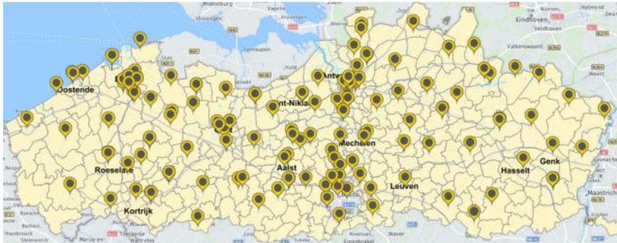
Kaart: Geografische spreiding van de bij de zwemfed aangesloten clubs.